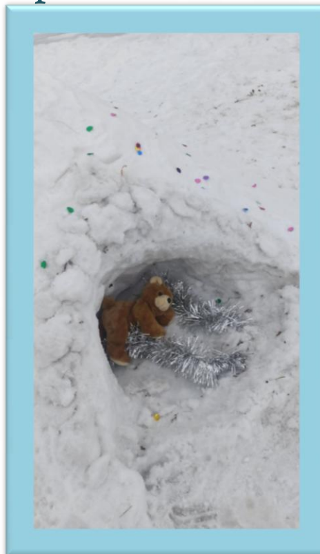
Берлога для медведя