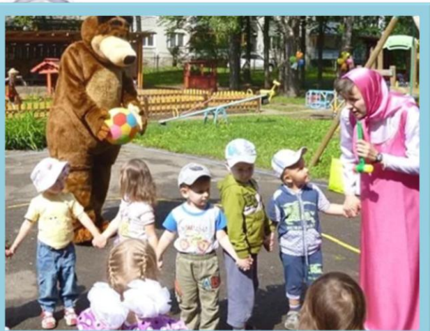
Игры с героями